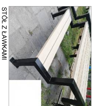
STÓŁ Z ŁAWKAMI