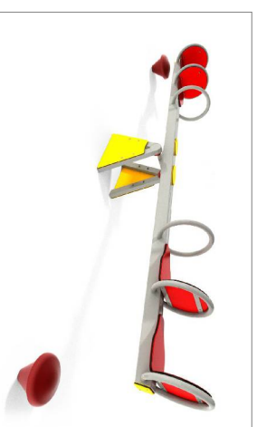
HUŚTAWKA WAGOWA CZTEROOSOBOWA